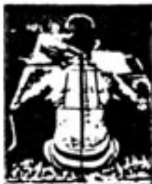
68 — Escritura derecha.

Una mesa que reúne buenas condiciones es la siguiente (fig. 69): 1° El reborde posterior de la mesa se encuentra en el mismo plano vertical que el borde