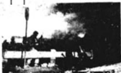
se City, su ciudad natal, a Errol Flynn para el estreno del film "Dodger City". Tras terminar el barbillero.